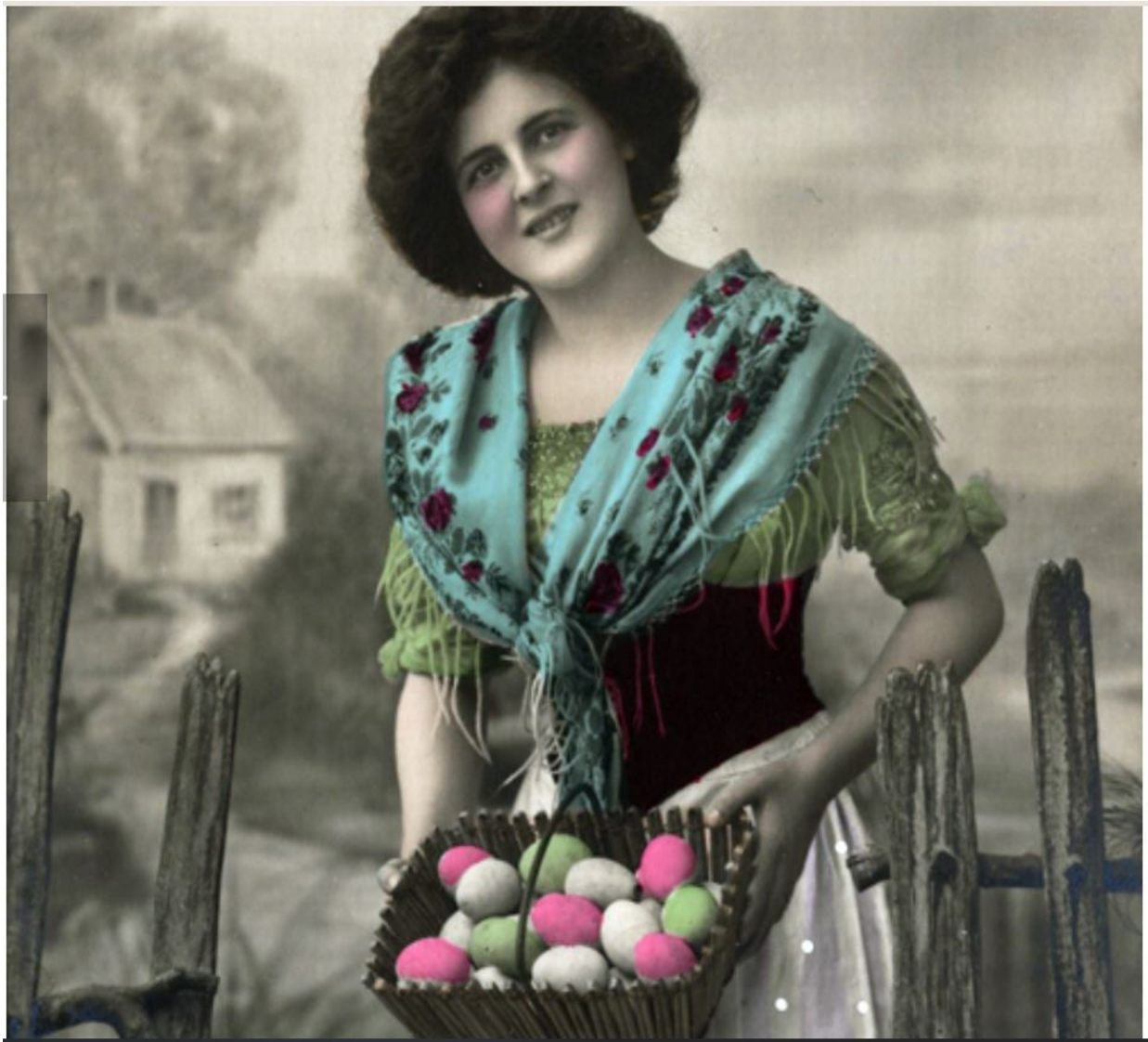
alte Ostergrußkarte, ca. 1920